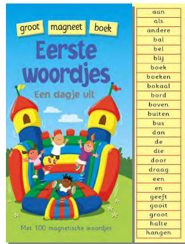
Eerste woordjes ISBN 978 90 8668 1181