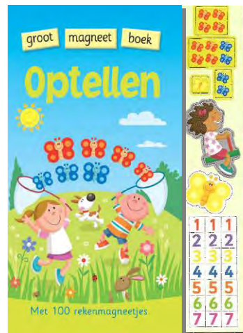
Optellen ISBN 978 90 8668 1198